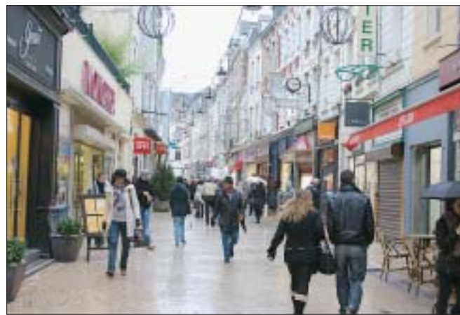
Les soldes vont remettre de l'animation dans les rues d'un centre-ville déserté après les fêtes.

Nous franchissons la porte de cette franchise de mode masculine. Le responsable, tout en étiquetant des dou-doues, explique qu'il ne pas